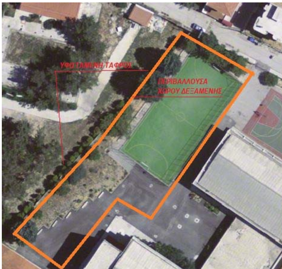
Σχ.1. Θέσεις προτεινόμενων ερευνητικών γεωτρήσεων